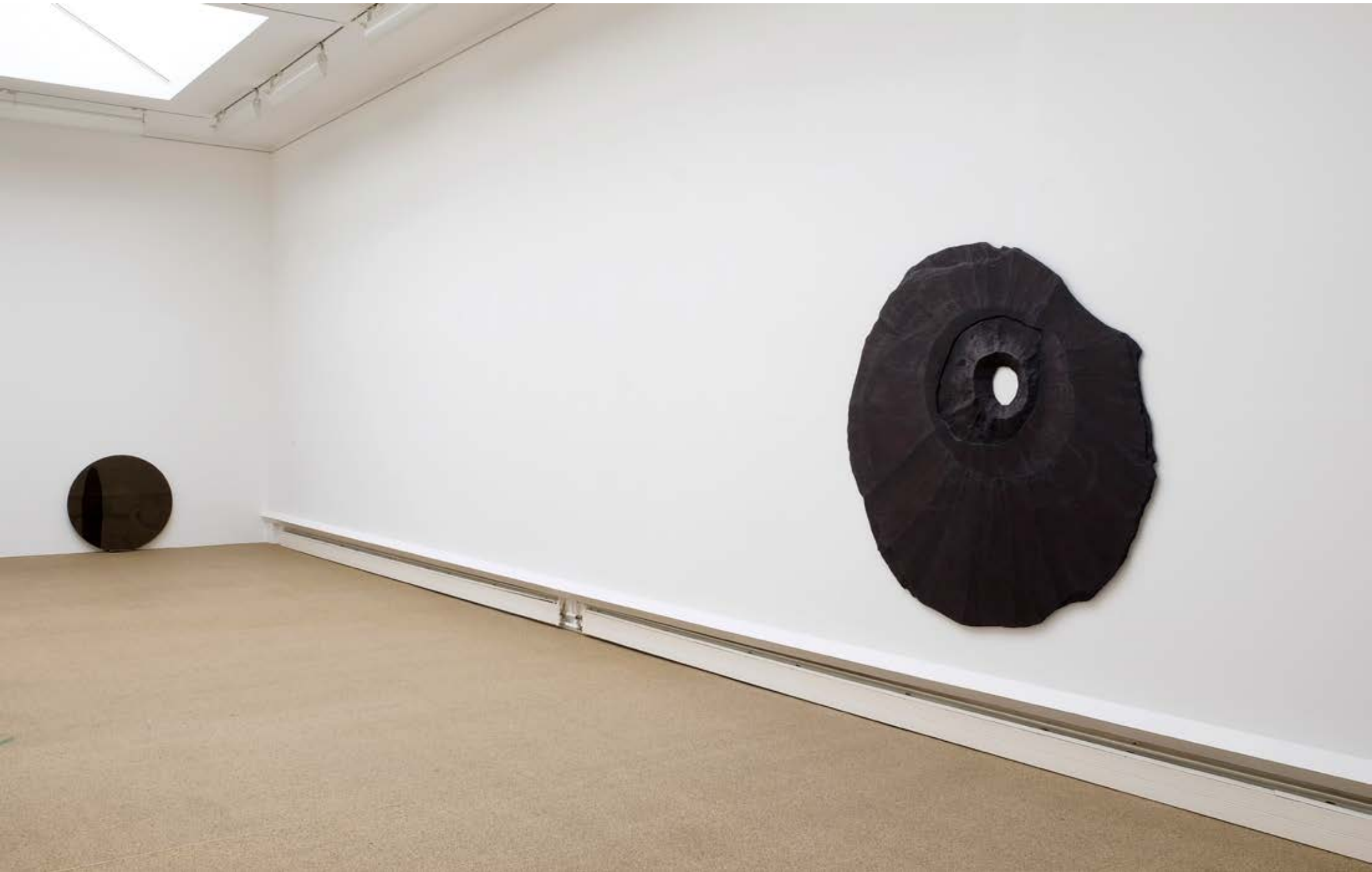
DUNKLER TONDO;2018;175x173x10cm;Enkaustik,Harzölfarbe,Holz,Kunststoff und DOPPELTONDO ZONE;2018-21;100x100x12cm;Glas,Blei,Holz,Wachs,Grafit,Farbe