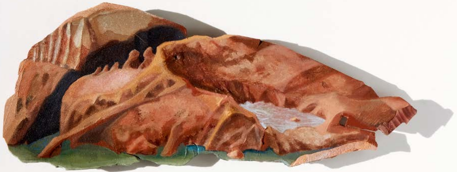
Mes Amis de Emmanuel Bove 191; 2020; 7x17,5x7,5cm