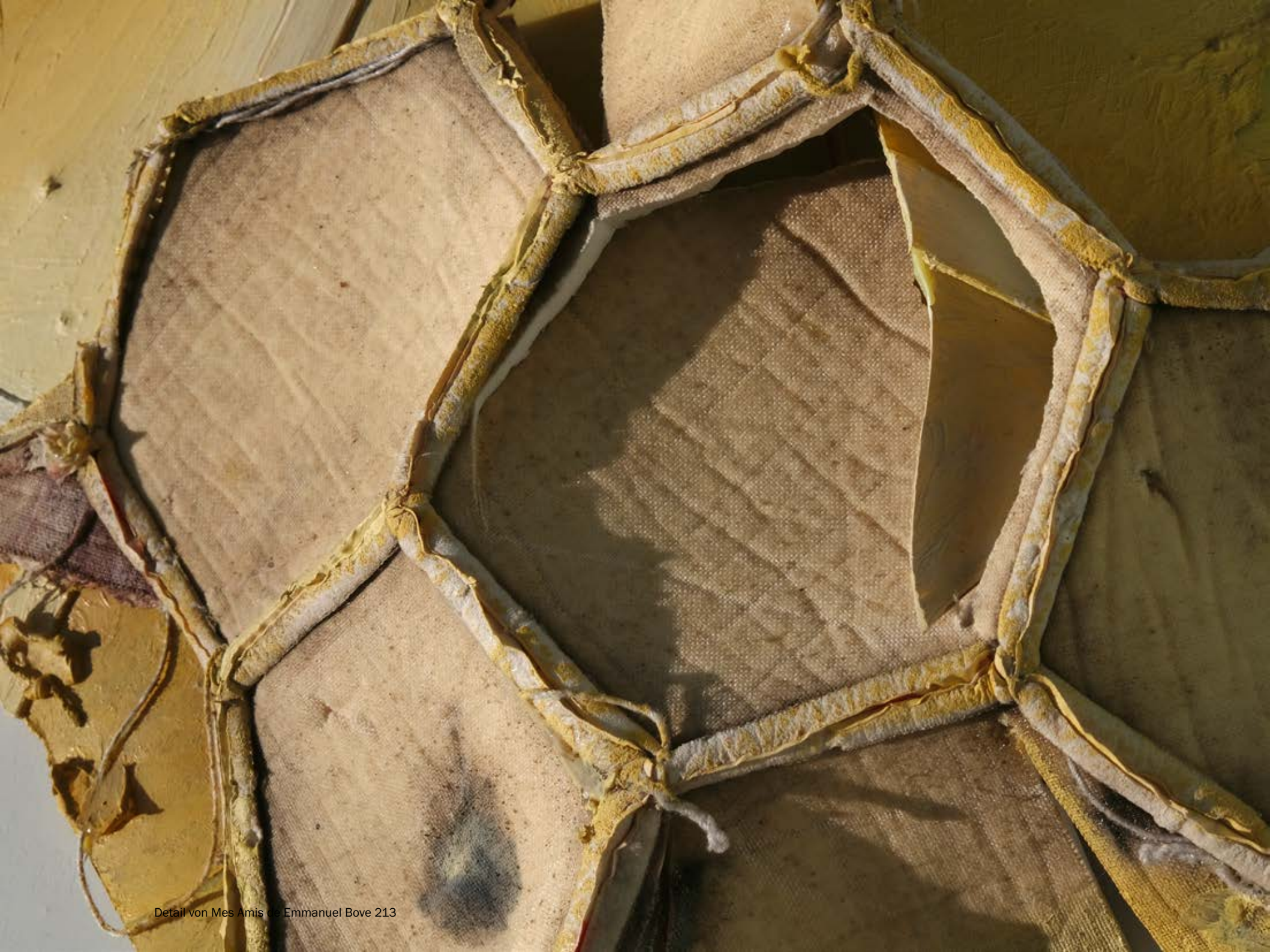
Detail von Mes Amis de Emmanuel Bove 213