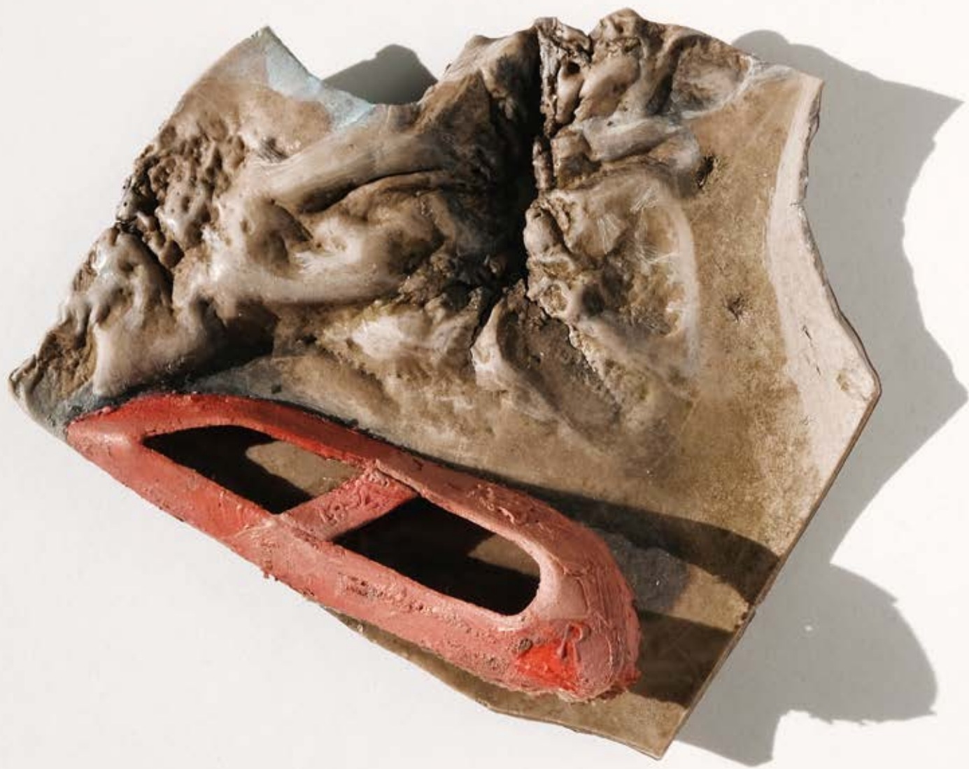
Mes Amis de Emmanuel Bove 232; 2021; 8,5x10,5x2,5cm