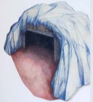
Ähnliche Insel, 2008-11; 88x92x2cm; Holz,Ölfarbe,Ritzungen und FRA-Bildintarsie, 2019-21; 154x189x2cm, Zucan,Harzölfarbe