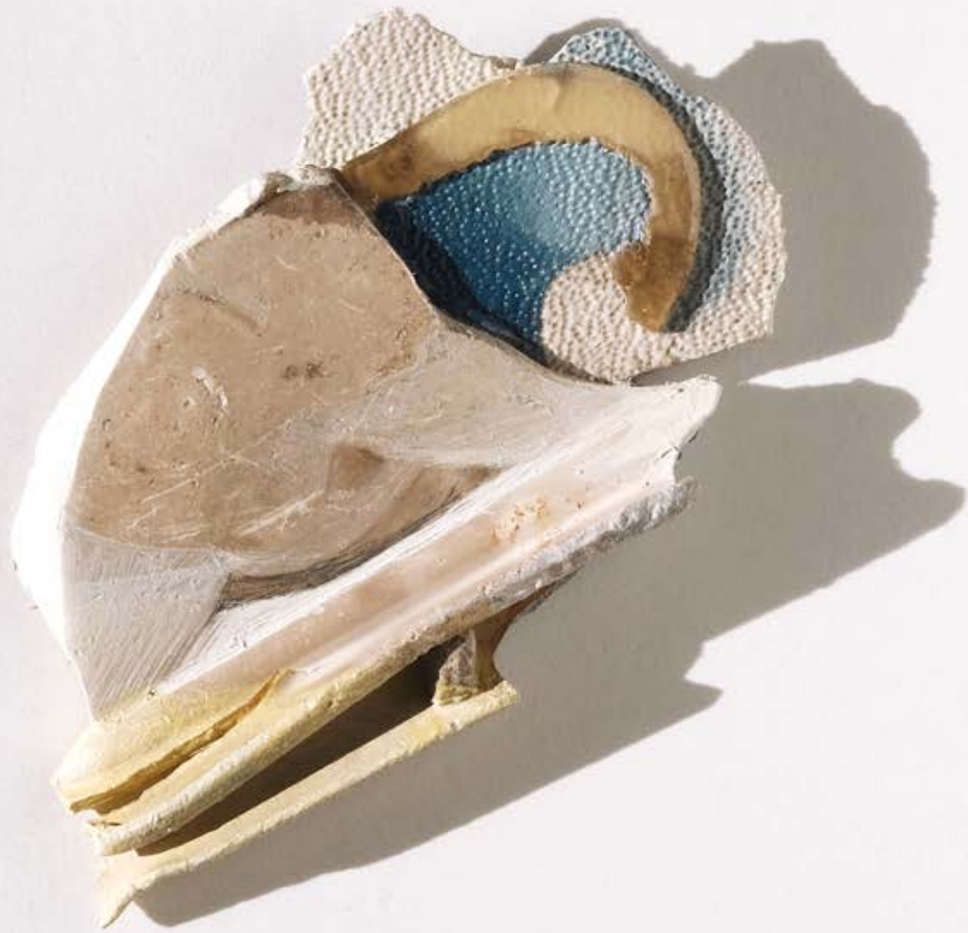
Mes Amis de Emmanuel Bove 227;2021;6,5x5,5x1cm