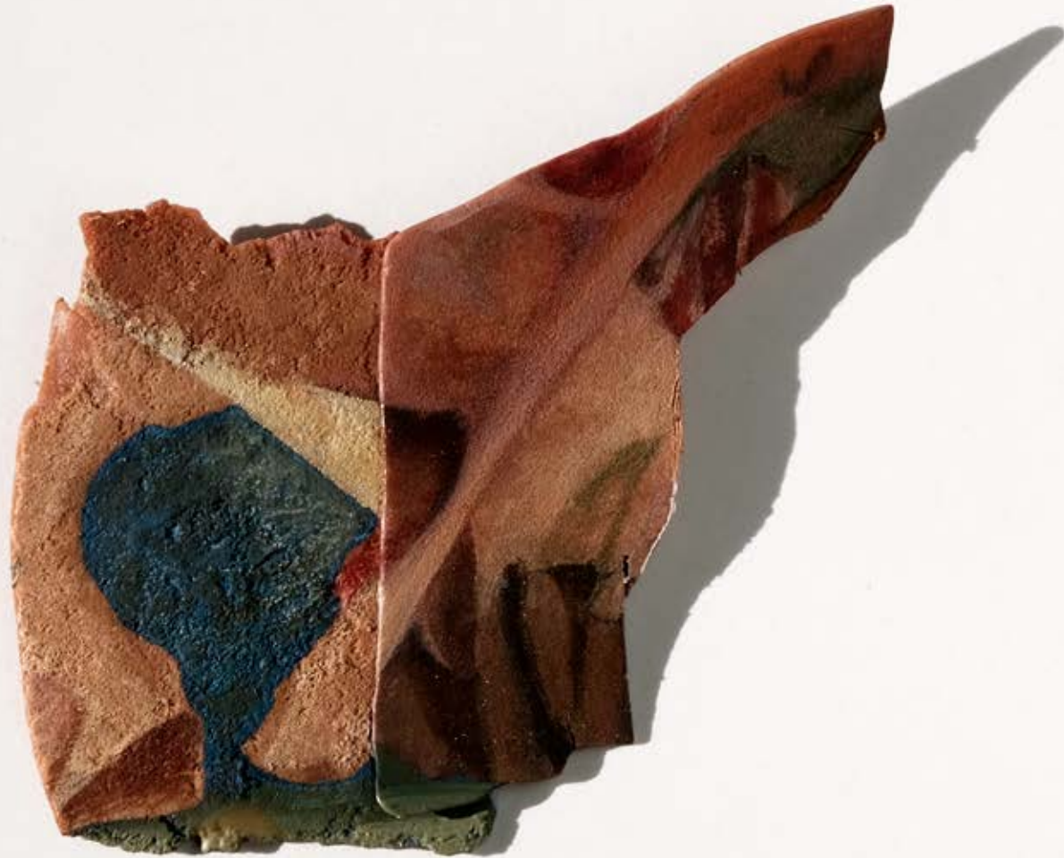
Mes Amis de Emmanuel Bove 192; 2020; 7,5x8x1cm