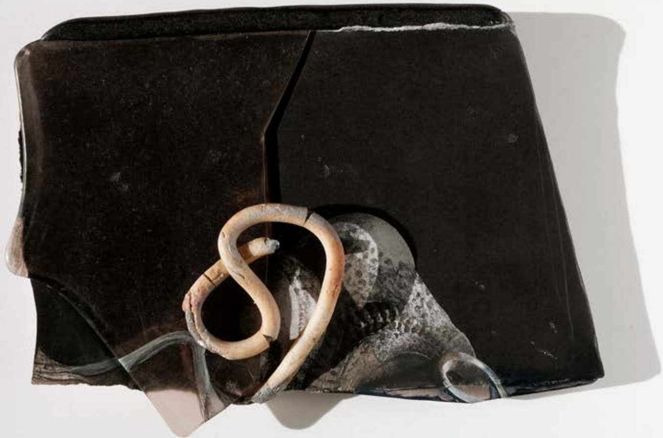
Mes Amis de Emmanuel Bove 202;2020;11x15x3cm