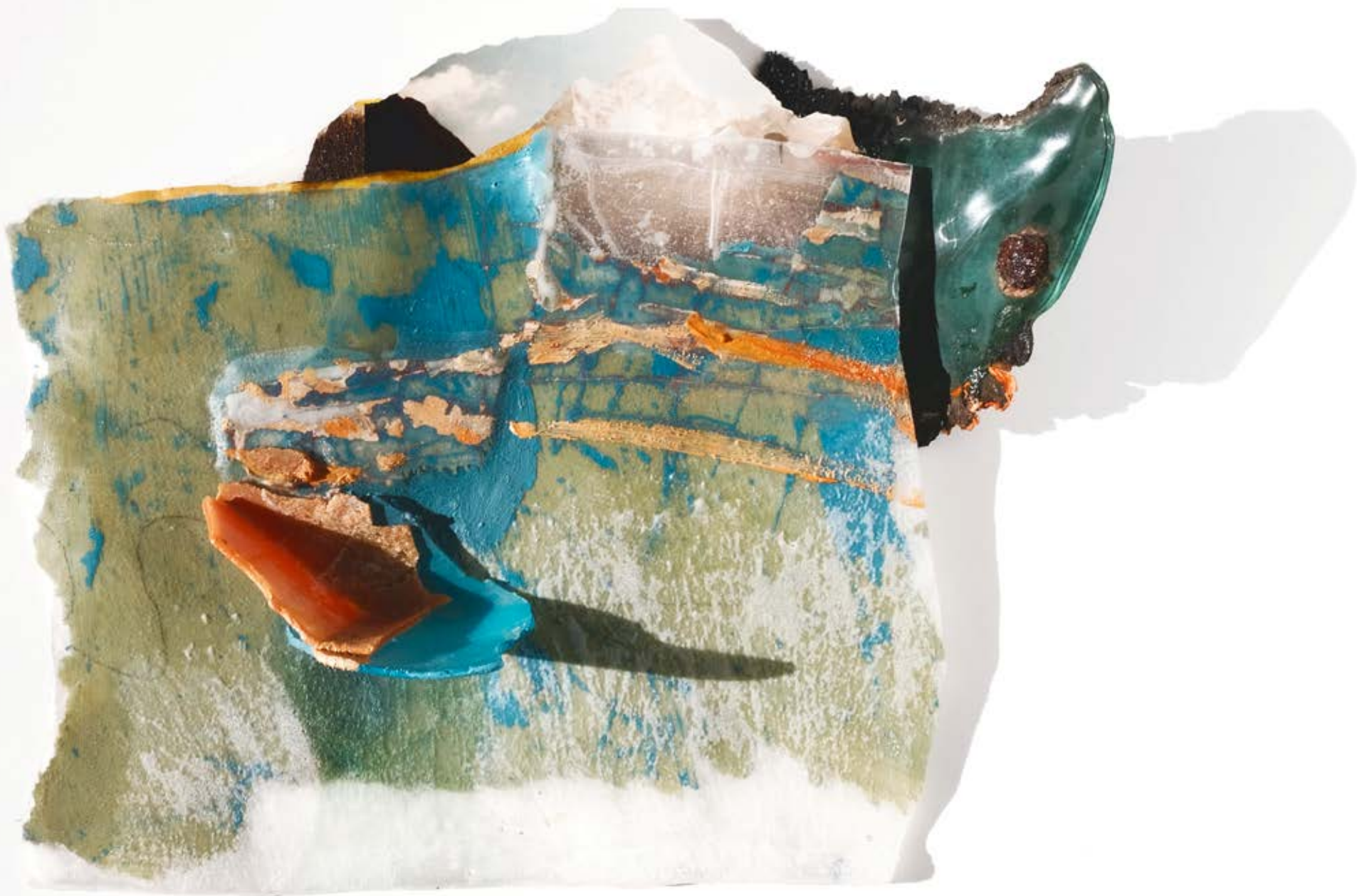
Mes Amis de Emmanuel Bove 228;2021;19,5x21,5x5cm