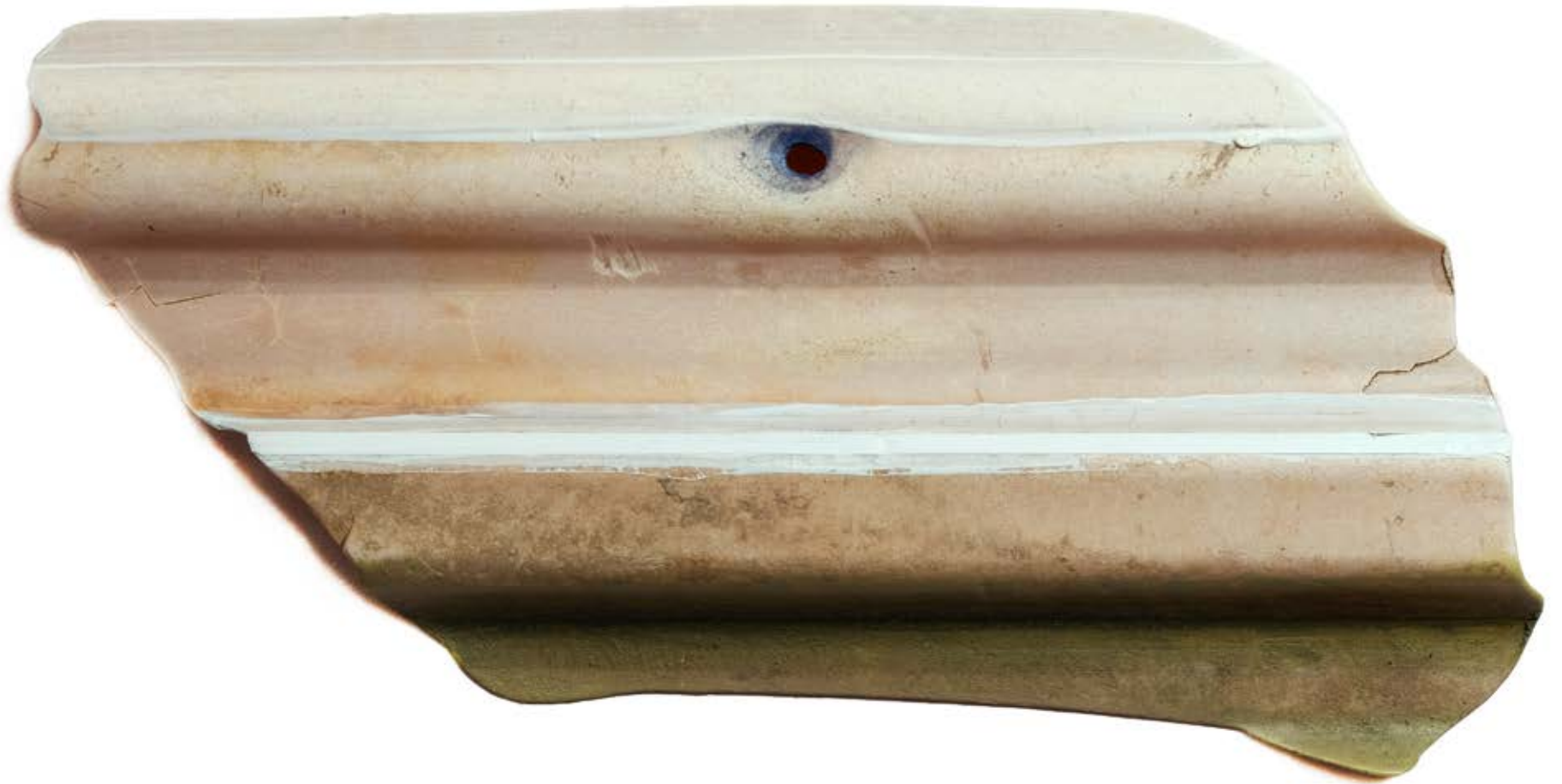
Mes Amis de Emmanuel Bove 235; 2021; 15x31x2cm