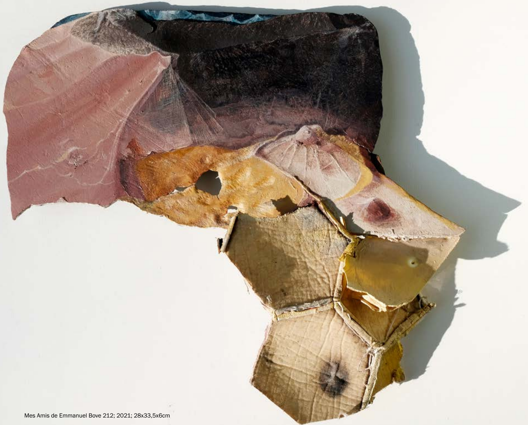
Mes Amis de Emmanuel Bove 212; 2021; 28x33,5x6cm