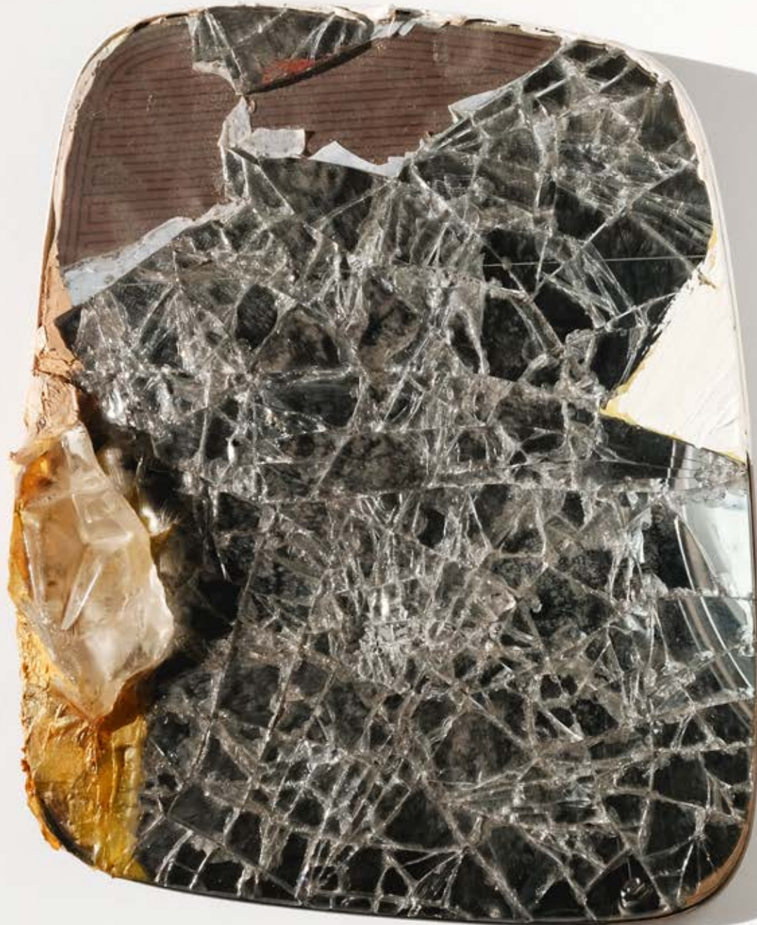
Mes Amis de Emmanuel Bove 200;2020;20,5x16,5x3cm