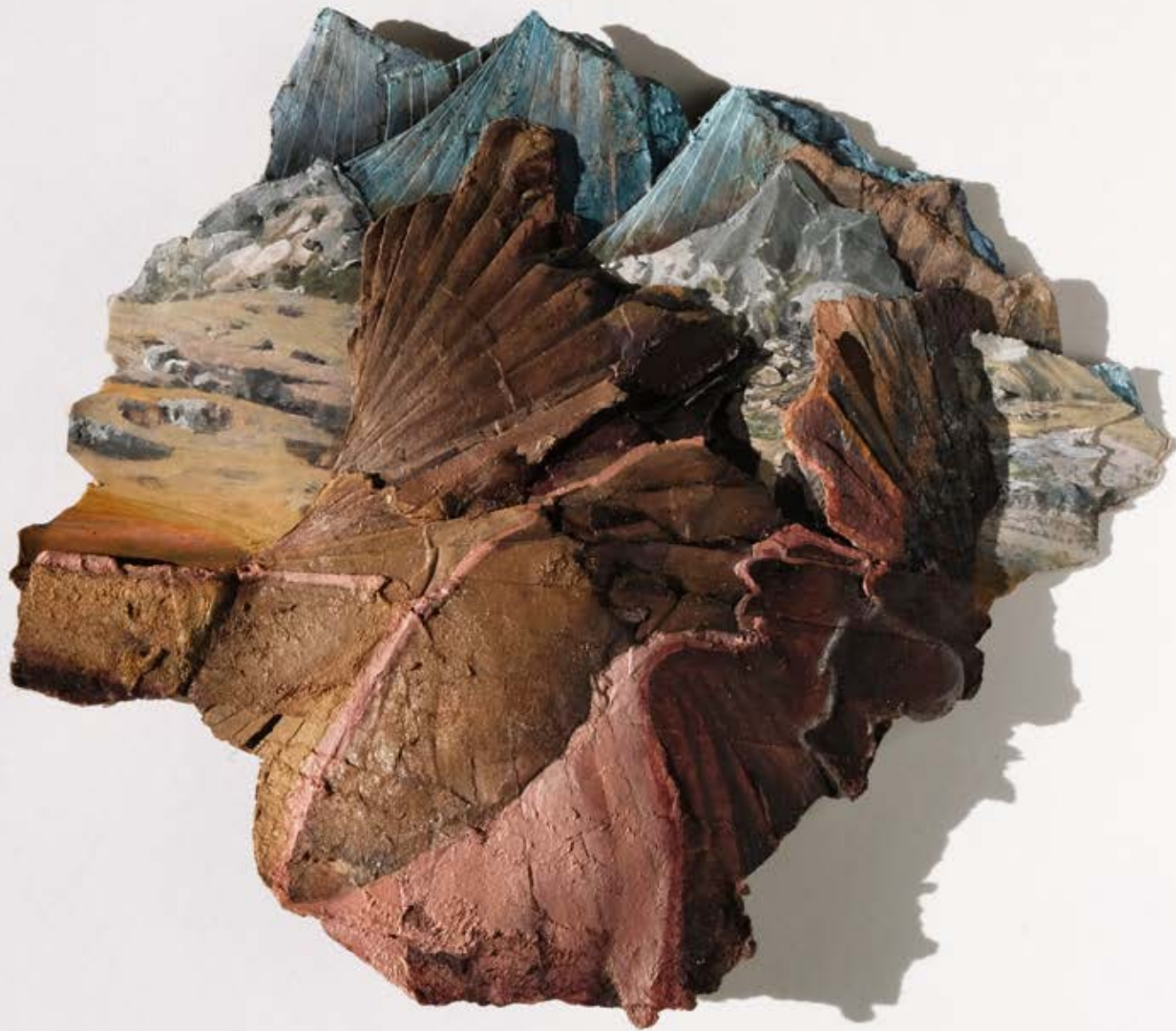
Mes Amis de Emmanuel Bove 209;2021;14x16,2x2cm