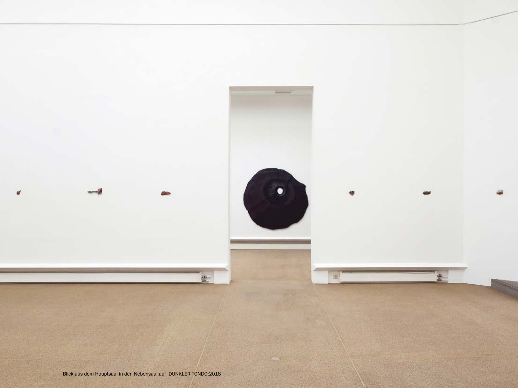
Blick aus dem Hauptsaal in den Nebensaal auf DUNKLER TONDO:2018