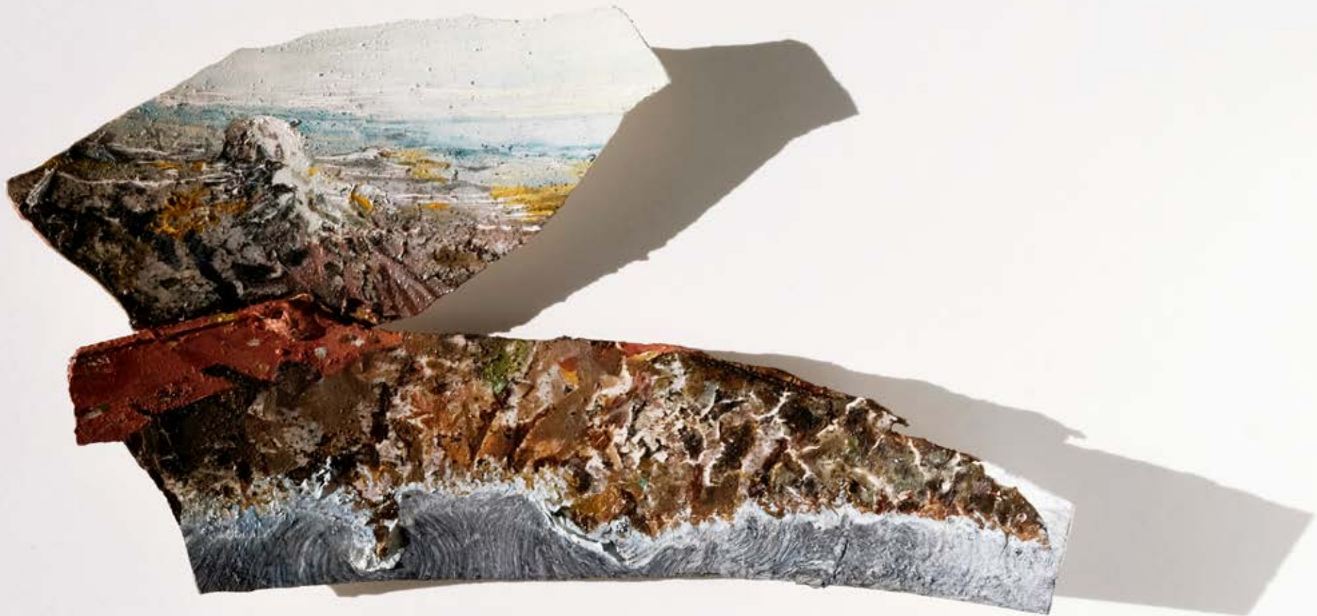
Mes Amis de Emmanuel Bove 215; 2021; 20,5x11x2,5cm