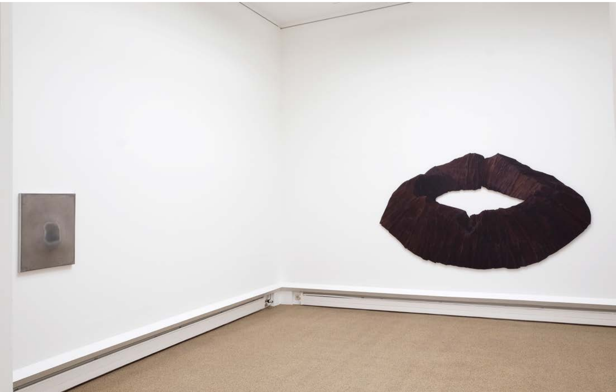
Ein Objektbild von Gotthard Graubner aus der Sammlung des Märkischen Museum Witten und CALDERA DARK CROWN, 2020; 161x256x3cm; Holz, Mischtechnik, Enkaustik