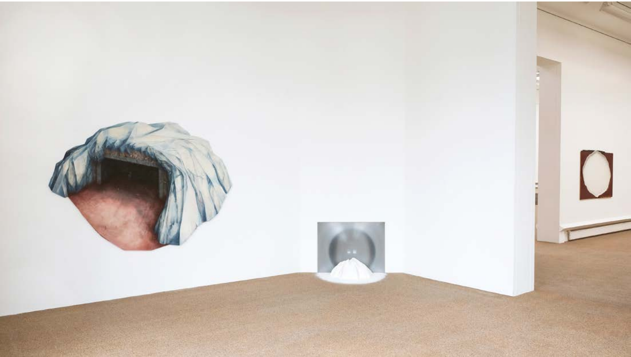
FRA-Bildintarsie, FRA GIPS;2019;41x70x50cm,Gips,Zucker,Monitorfolie und Blick auf ROTE TAFEL, Geist