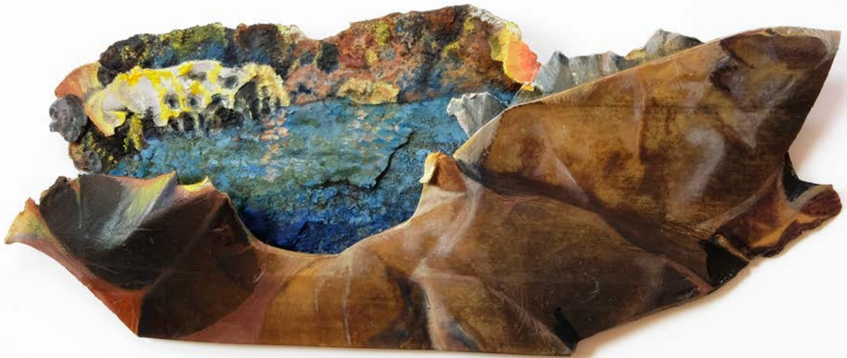
Mes Amis de Emmanuel Bove 194; 2020;5,8x14,7x1,5cm